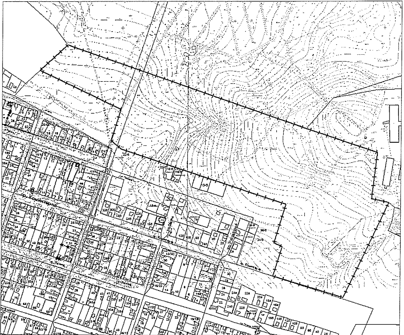
Схема границ территории юго-восточной части кадастрового квартала 29:27:060415 для подготовки проекта планировки и проекта межевания